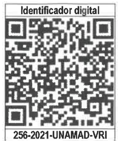
Cuadro 1. Equipo UNAMAD

Puerto Maldonado, 29 de diciembre de 2021